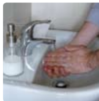
Hygiène des mains