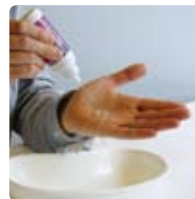
Rinçage de la lentille